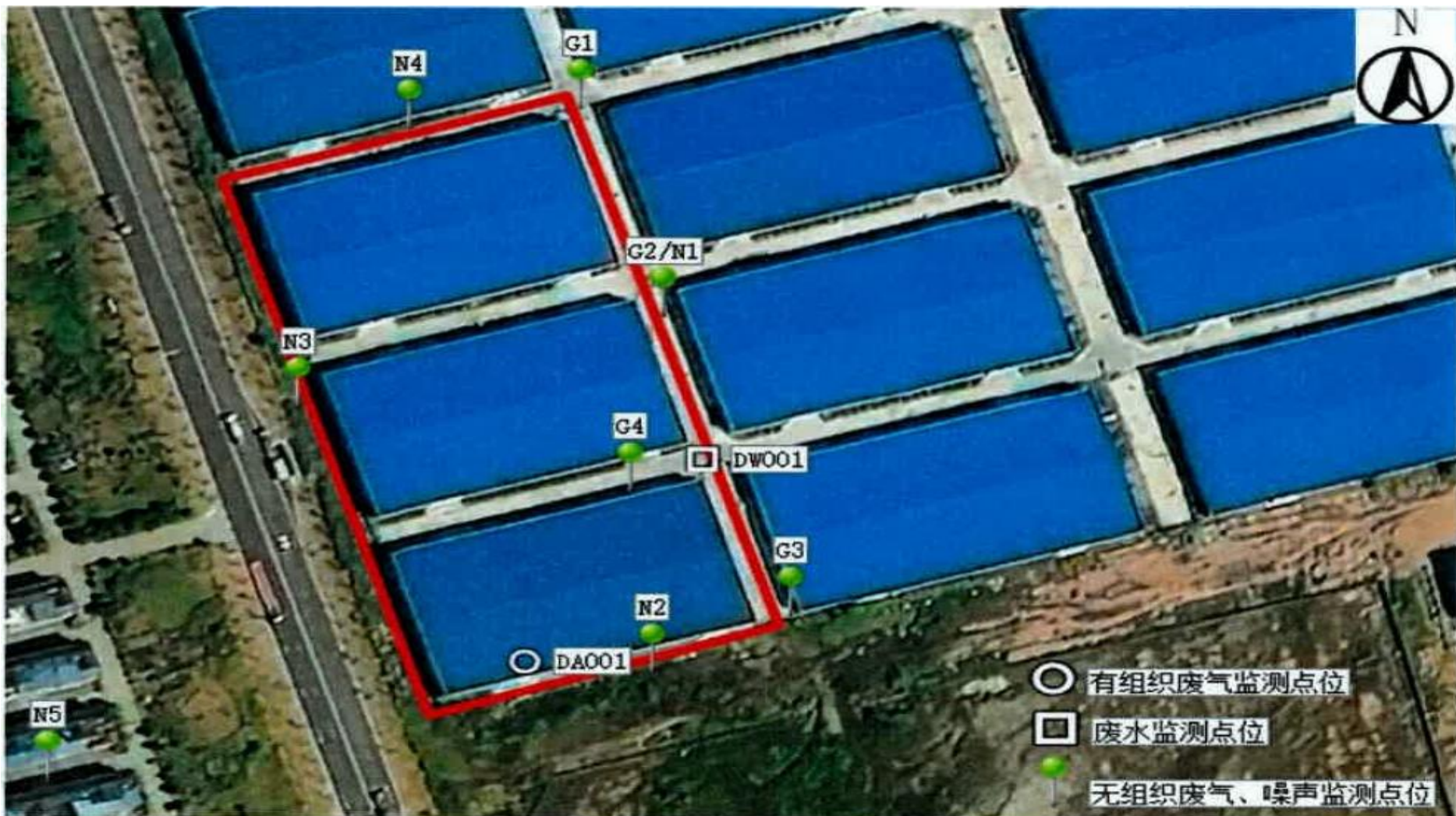
附图 4 项目验收监测点位示意图