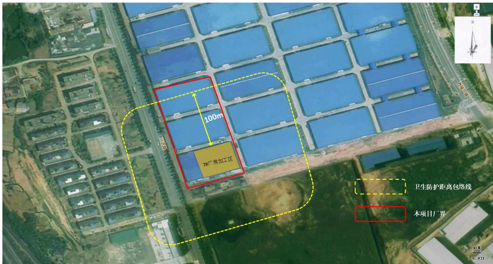
附图5 项目卫生防护距离包络线图