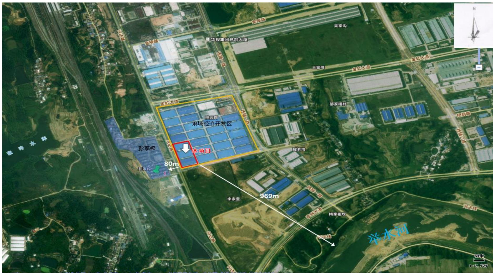
附图 2 项目周边环境关系示意图