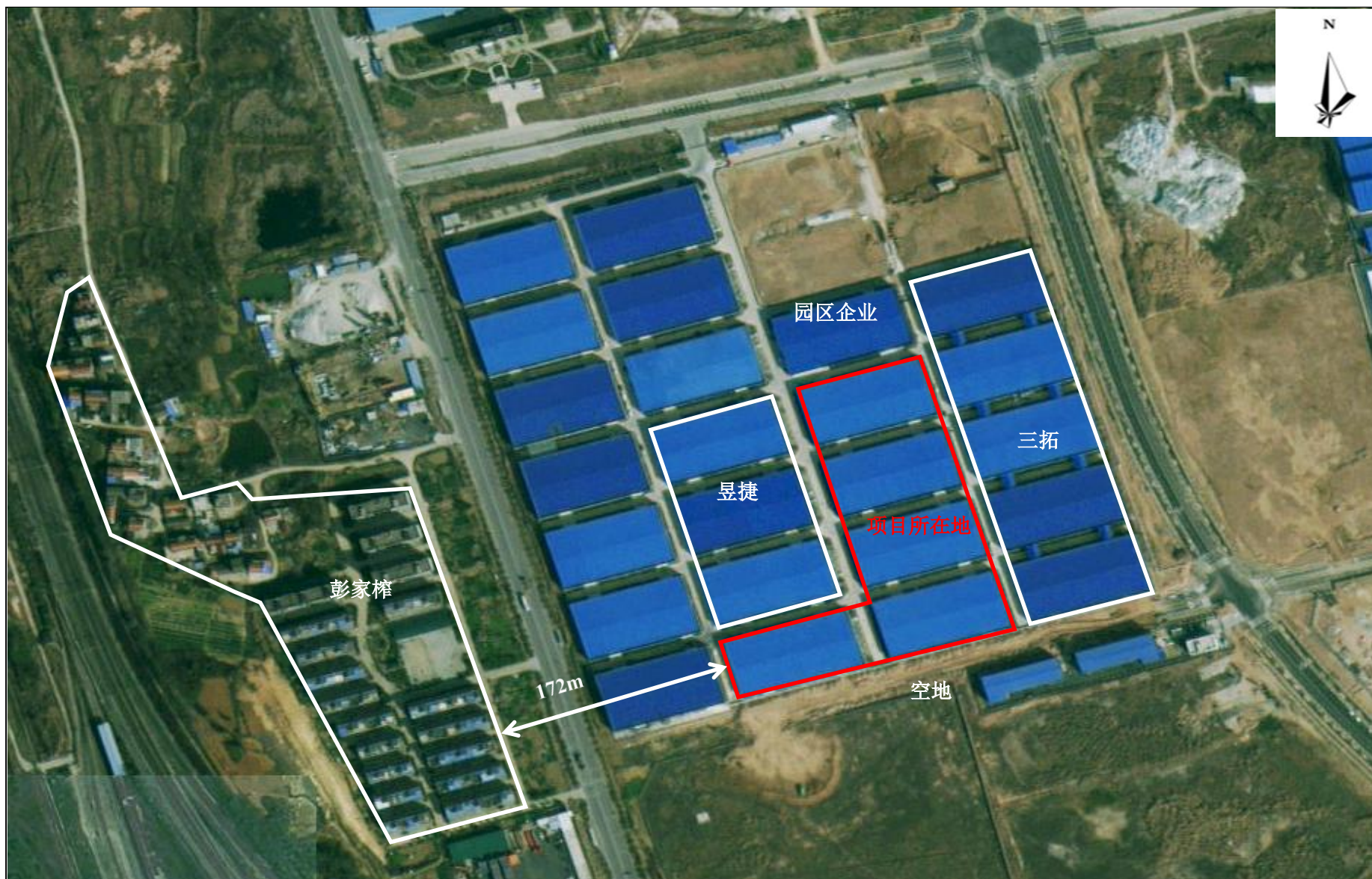
附图 2 项目周边关系示意图