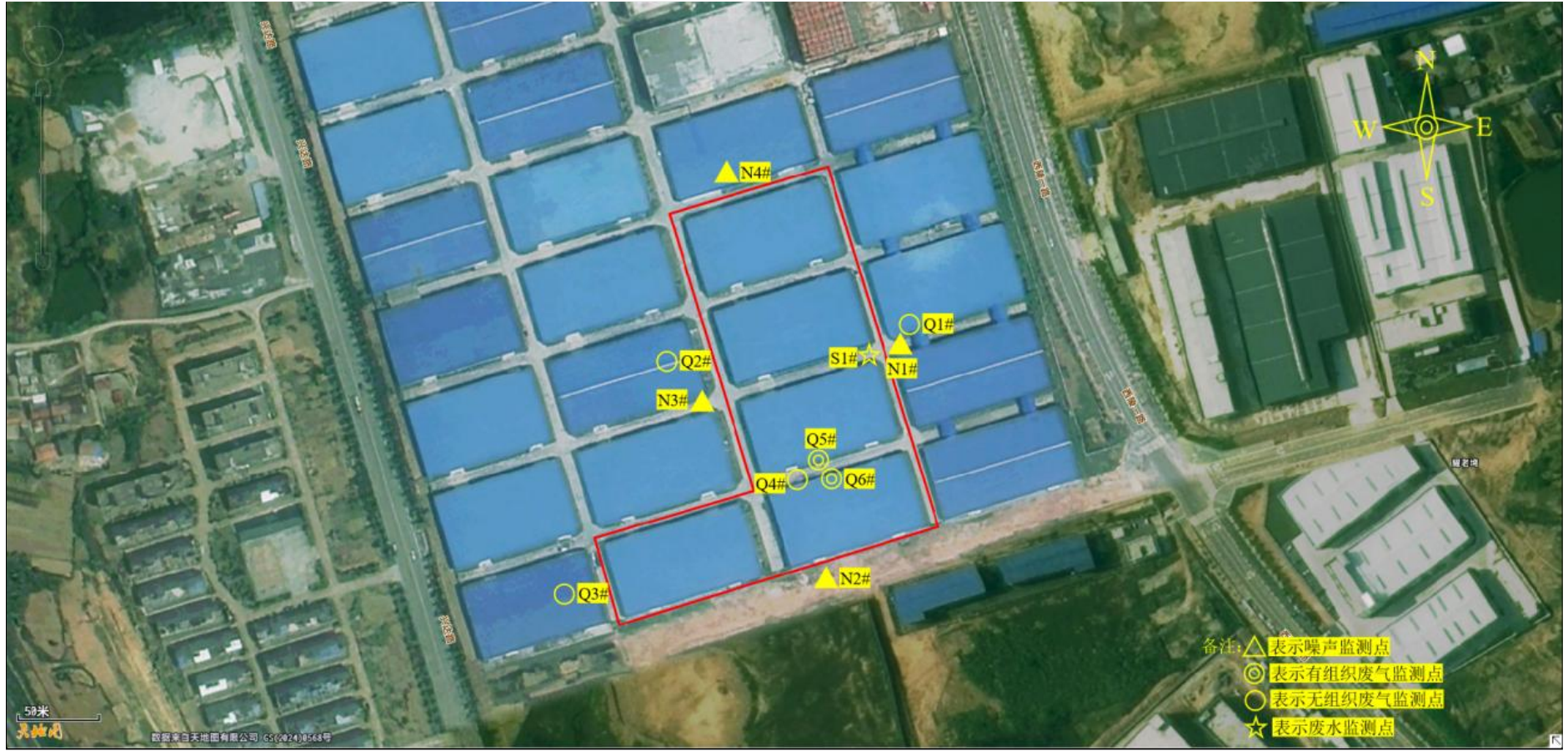
附图4 项目验收监测点位图